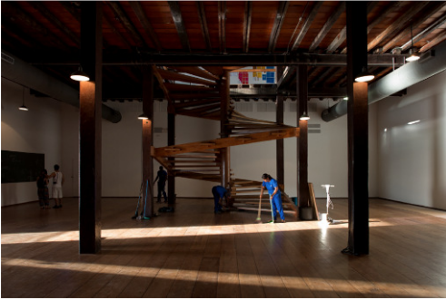
Solar do Unhão Salvador da Bahia 1959-1963