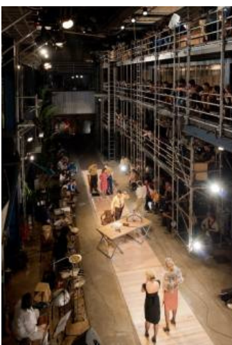
Teatro Oficina Sao Paulo Bühne mit Zuschauerenebene 1984-1989