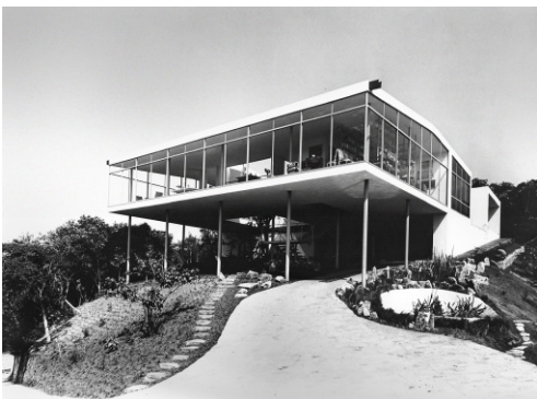
Casa de Vidro São Paulo 1949-1951 Außenansicht kurz nach Fertigstellung