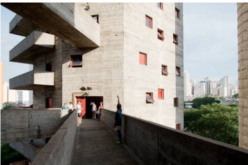
SESC – Fabrica da Pompeia São Paulo 1977-1986