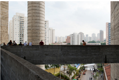
SESC – Fabrica da Pompeia São Paulo 1977-1986