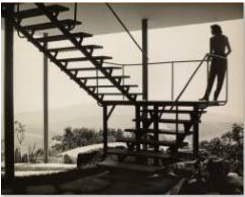
Casa de Vidro São Paulo Mit Lina Bo Bardi 1949-1951