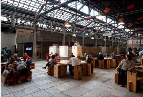
SESC – Fabrica da Pompeia São Paulo 1977-1986