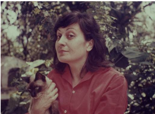
Lina Bo Bardi, 1960

You can find all images in the online download http://www.pinakothek.de/presse These images may be used free of charge for editorial reporting on this exhibition, on condition that the photographer and the copyright holder are credited as the source.