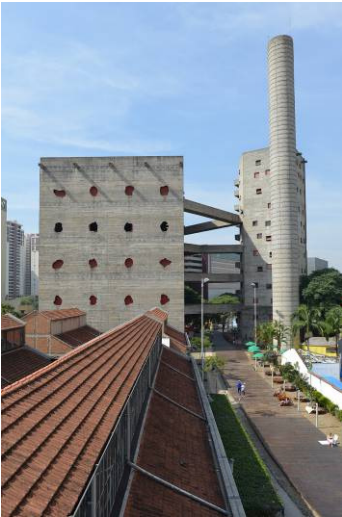
SESC – Fabrica da Pompeia São Paulo 1977-1986