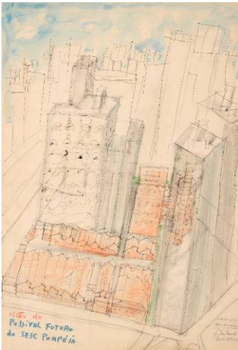
Lageskizze für das SESC – Fabrica da Pompeia São Paulo Zeichnung von Lina Bo Bardi, 1977